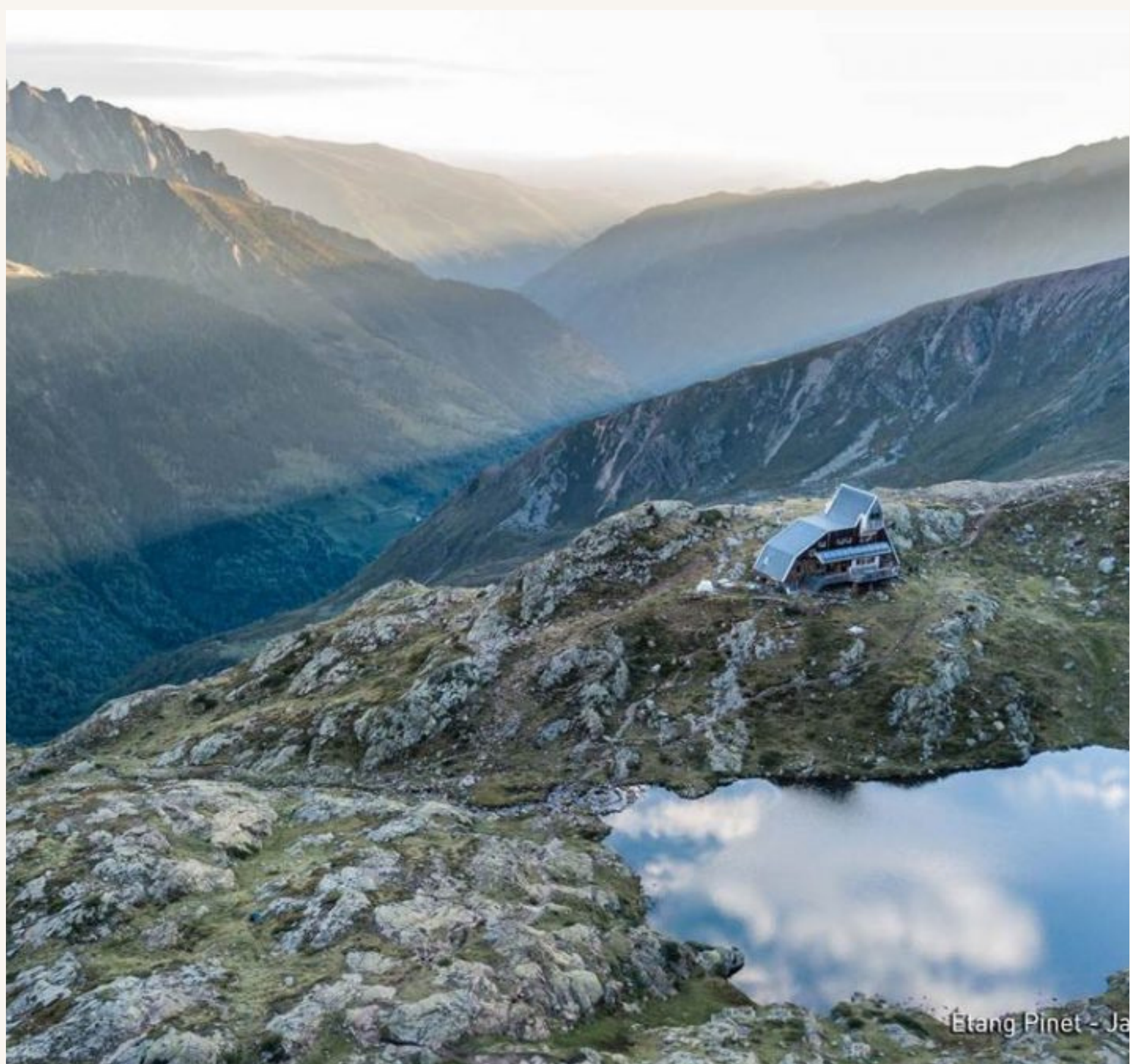
Étang Pinet - Ja